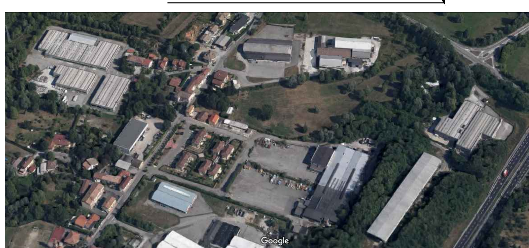
TESSUTO PRODUTTIVO ESISTENTE